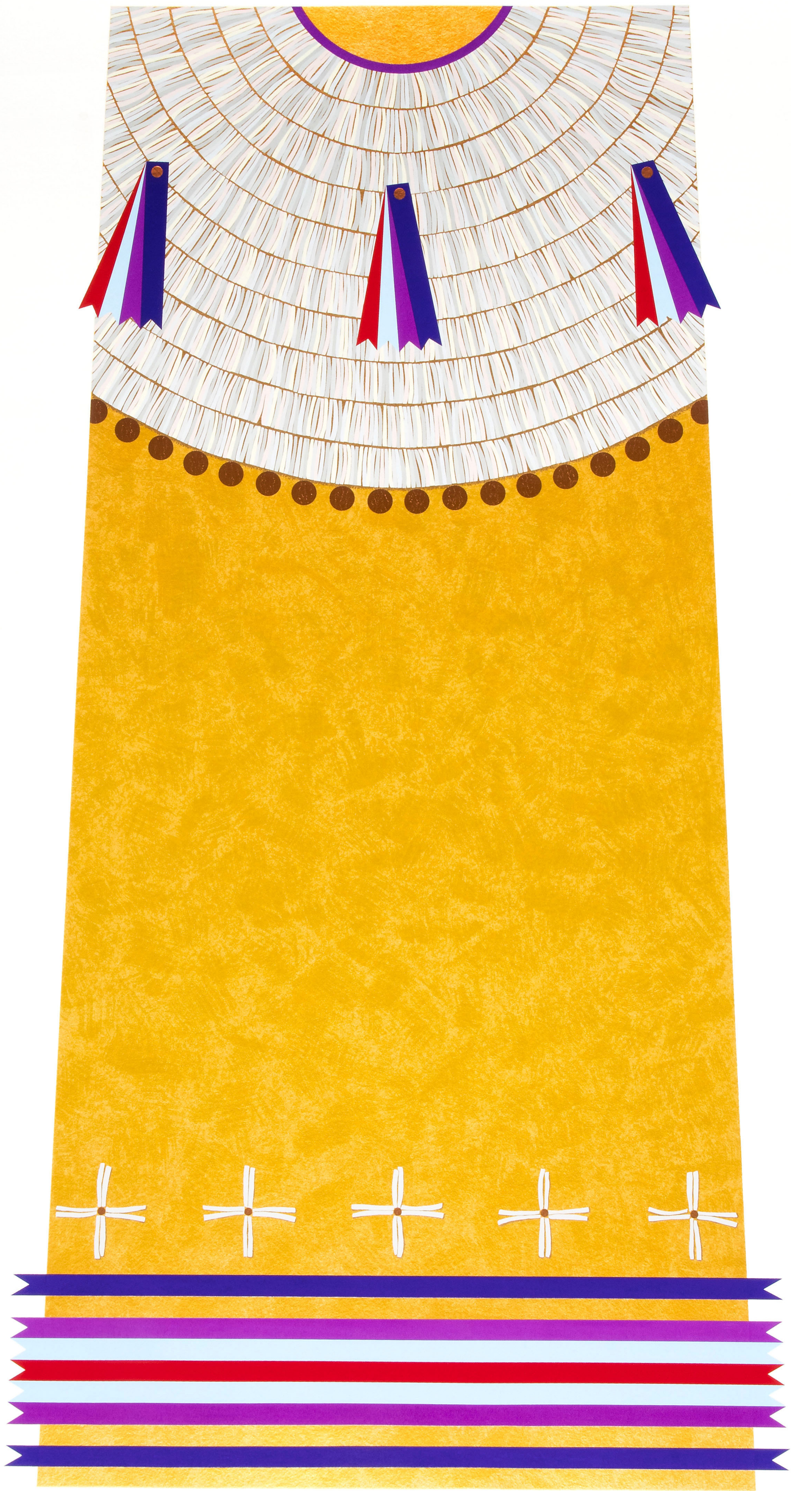
Dyani White Hawk (Sičáŋǵu Lakota) Wókaǵe | Crea, de la serie Cuida de ellos 2019