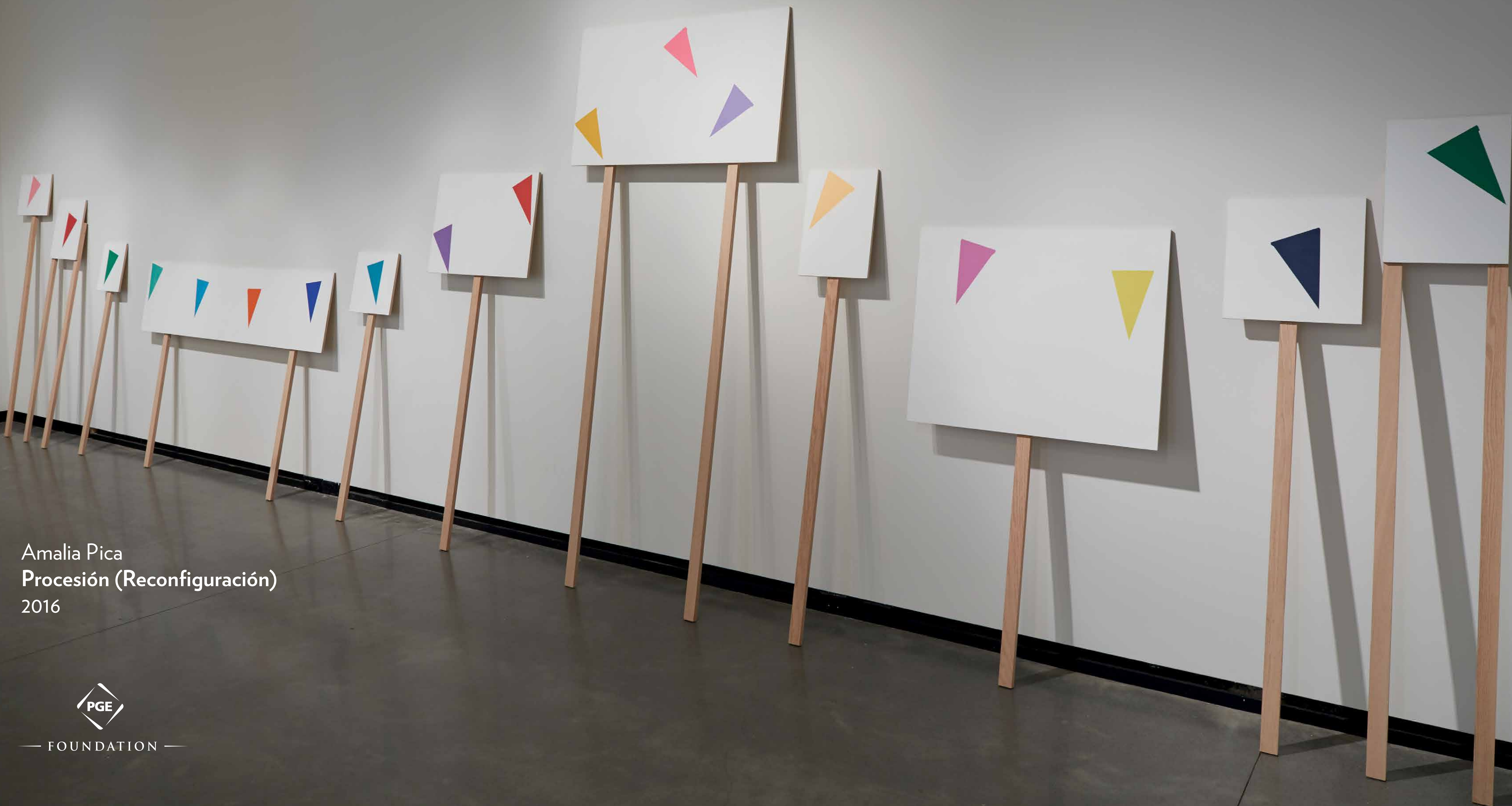
Amalia Pica Procesión (Reconfiguración) 2016